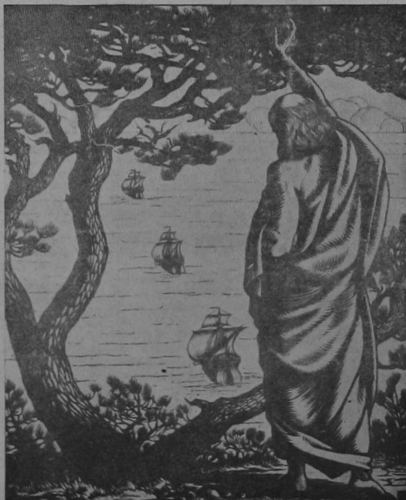
Dios nos concedió la victoria dándonos un altísimo destino: el de completar el planeta y borrar los antiguos linderos del mundo.